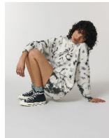
Stella Kicker Tie and Dye